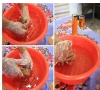
接著就只要靜置約十五分鐘之後，即可食用。

之丘，鳥瞰 3 個縣市的美景（雲林、嘉義、南投）。冬暖夏涼、避暑聖地、四季宜人。有豐富的生態森林之旅，夏季有閃閃發亮的螢火蟲，以及天然的滑水道遊憩區。